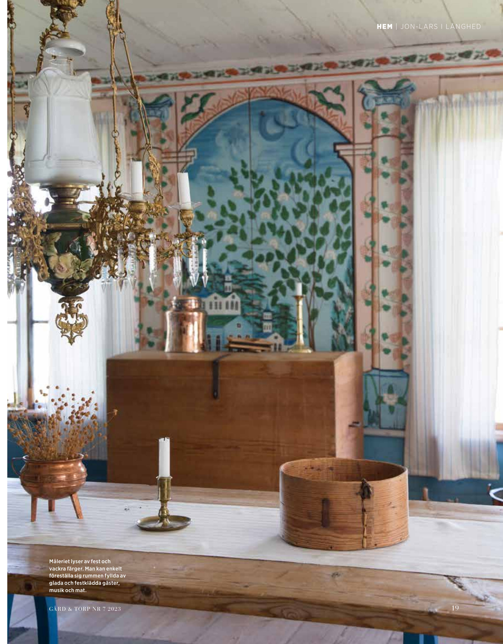
Måleriet lyser av fest och vackra färger. Man kan enkelt föreställa sig rummen fyllda av glada och festklädda gäster, musik och mat.

Bröderna hade tagit över gården efter föräldrarna på 1830-talet och den var sedan gammalt en av traktens mest välmående. Hälsingbönderna gjorde stora vinster både på lantbruk, skog och lin och det välståndet ville man minsann visa upp. I landskapet växte den ena storvulna mangårdsbyggnaden efter den andra fram. Just Långhed kallas skämtsamt för "bondeslottens by", det var särskilt många här som satsade stort på sina bostadshus. Man tävlade med varandra i både storlek och utsmyckning. Granna brokvisitar i många färger och utsmyckningar skulle det vara, och invändigt anlitas målere för att skapa de mest vidunderliga rum med målade landskap, figurscener och mönster. Att besöka en Hälsingegård i mitten av 1800-talet var en uppvisning i vad man kunde åstadkomma med lite färg och →